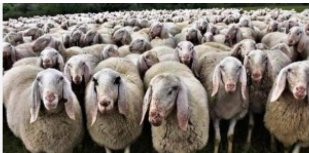
immunità di... gregge

In attesa che sia censurato anche un articolo simile che presenta i danni dello pseudo-vaccino ( come tutti quelli presenti al “tag” vaccino che trovate in fondo alla pagina) leggiamo con attenzione e difendiamoci dai vaccinati-covidioti- cittadini di serie A per non ammalarci. Teniamoli a distanza insieme alla loro ancor più micidiale tendenza all’addomesticamento di gregge ( altro che immunità di gregge!). ( GLR)